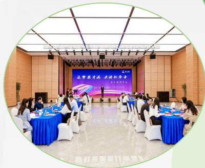
英才港周年庆活动