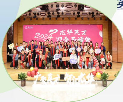
2024龙华英才迎春 茶话会

每月开展形式丰富的创新创业交流，促进优势资源流动，助力各类人才在龙华筑梦逐梦圆梦。